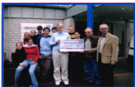
„Aktion Tagwerk“ seit 1979 für die Lebenshilfe e.V.