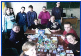
Sport-Spiel-Spaß-Tag: Gemeinschaft erleben