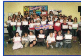
Teilnahme an Wettbewerben hier: The Big Challenge