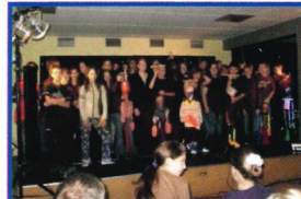
Musik+ Theater Gemeinsam „etwas auf die Beine stellen“