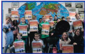
Einsatz für die SOS-Kinderdorfarbeit seit 1974

Die Stärkung der Ich-Kompetenz und die Stärkung der Sozialen Kompetenz wollen wir fördern und ausbauen durch geeignete Projekte und Aktionen, wie z.B.: