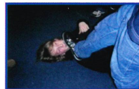
Das Projekt „Streitschlichter“ Konflikte friedlich lösen