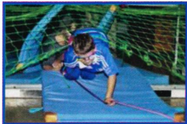
Erlebnis pädagogik und Klettern Vertrauen in mich und andere gewinnen