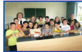
Gesundes Frühstück - Gesunde Ernährung